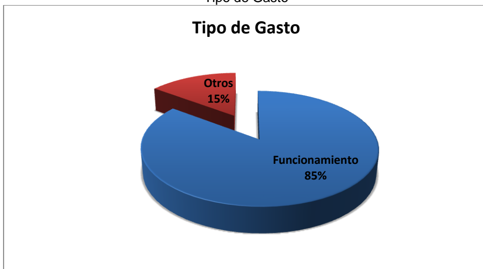
Grafico No. 3 Tipo de Gasto

Fuente: Sistema de Rendición de Cuentas en Línea –RCL Elaboró: Dirección Técnica de Infraestructura Física