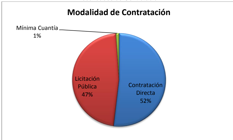
Grafico No. 1 Modalidades de Contratación

Fuente: Sistema de Rendición de Cuentas en Línea – RCL Elaboró: Dirección Técnica de Infraestructura Física.