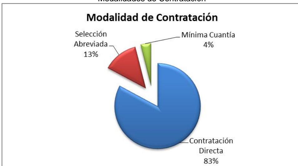
Gráfico No. 1 Modalidades de Contratación

Fuente: Sistema de Rendición de Cuentas en Línea –RCL Elaboró: Dirección Técnica de Infraestructura Física