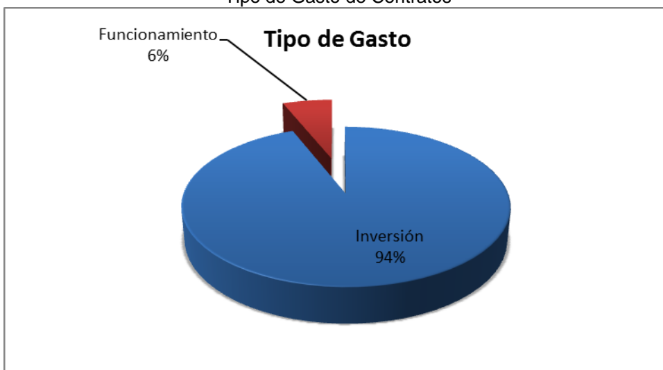
Grafico No. 3 Tipo de Gasto de Contratos

Fuente: Sistema de Rendición de Cuentas en Línea –RCL Elaboró: Dirección Técnica de Infraestructura Física