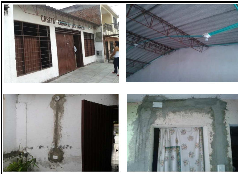
Casa Comunal Las Americas

Observaciones: Instalación de las redes eléctricas en toda la casa comunal. No se ejecutó ningún otro ítem.