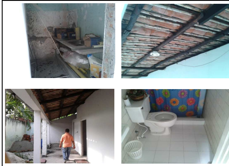
Casa Comunal Barrio Saavedra Galindo

Observaciones: Cambio de Cubierta en la zona trasera de la Casa Comunal, se hicieron los acabados del baño (enchape en pisos y paredes), además se construyó una cocina (meson, paredes) se encuentra sin terminar.