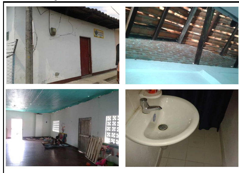
Casa Comunal Jorge Eliecer Gaitan

Observaciones: Se cambio totalmente la cubierta , pero no se coloco el cielo falso. Tambien se instalo enchape a la cocina y al baño.