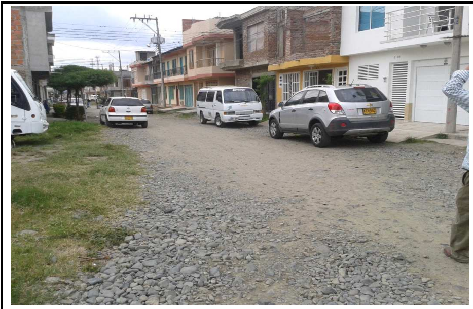
Calle 6 Entre Carreras 2 y 4

Observaciones: Se ejecuto la excavación, la conformación y el relleno. Pero no se realizo la losa en concreto.