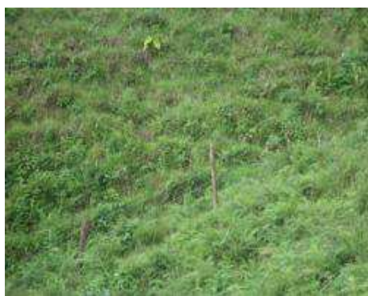
Plano general Zona general reforestada