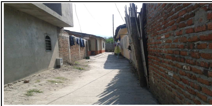
Calle 7a Entre Carreras 11 y 12