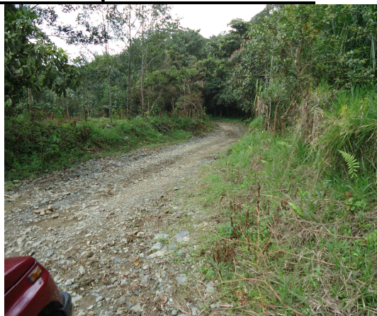
Estado actual sitio de extracción del material de arrastre y vías intervenidas