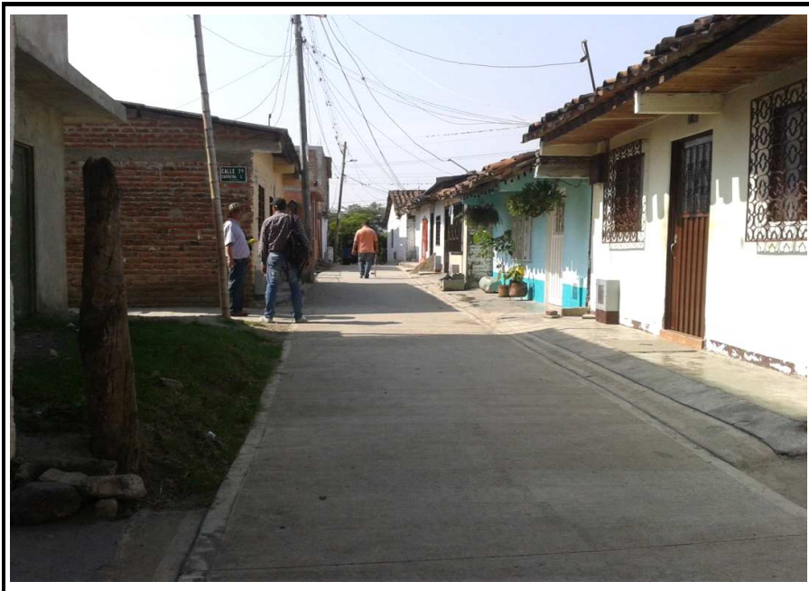
Carrera 11a Entre Calles 7 y 8

Observaciones: La vía se encontró al final de ella sin terminar.