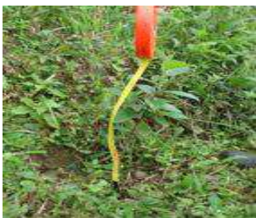
Altura de las plantulas, aproximadamente 45 cm