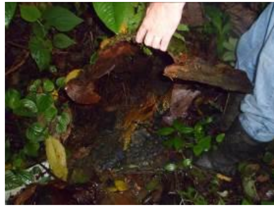
Tanque de almacenamiento de acueducto de corregimiento de Santa Rosa de Tapias, y nacimiento de recurso hídrico