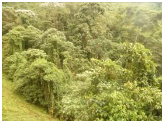
Bocatoma del acueducto y sitio del predio el tabor 1