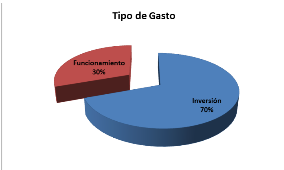
Grafico No. 2 Tipo de Gasto de Contratos

Fuente: Sistema de Rendición de Cuentas en Línea –RCL Elaboró: Dirección Técnica de Infraestructura Física