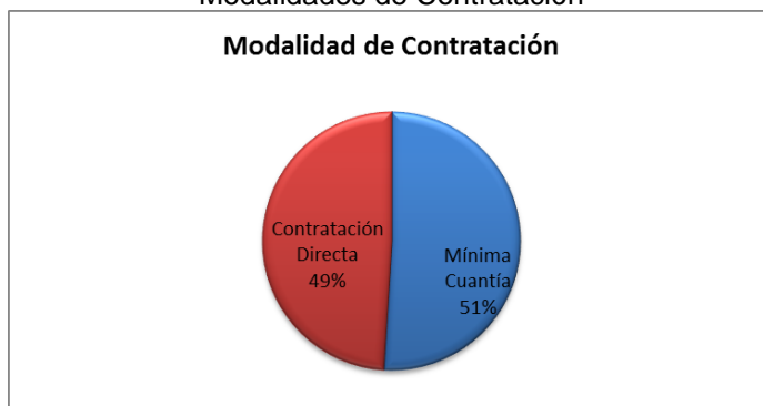
Grafico No. 1 Modalidades de Contratación

Se concluye con lo anterior que la contratación se ejecutó bajo las modalidades de Mínima Cuantía con un porcentaje del 51,00 % por valor doscientos sesenta y siete millones seiscientos cincuenta y cuatro mil quinientos sesenta pesos moneda corriente ($268.654.560) y Contratación Directa en un 49,00%, por valor de doscientos cincuenta y ocho millones doscientos veintitrés mil setecientos ochenta y cinco pesos moneda corriente ($258.223.785), como se muestra en la siguiente gráfica: