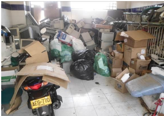
Inadecuado almacenamiento de material reciclable

;Una Entidad Vigilante, una Comunidad en Acción!