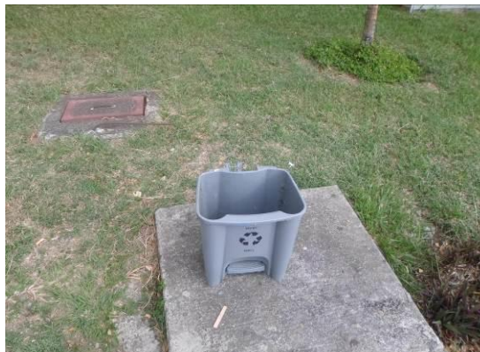
Recipientes en mal estado