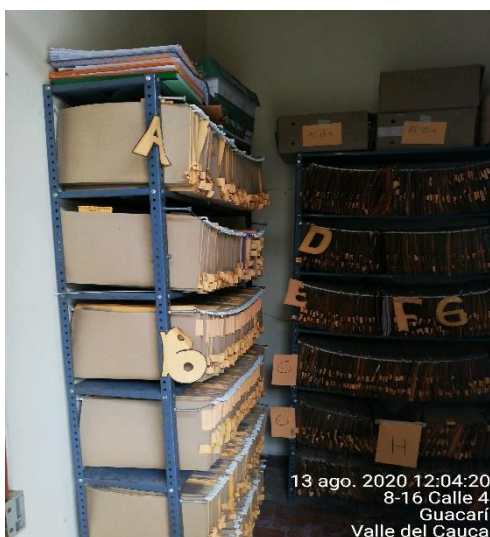
Imagen No. 1

Se adjuntan imágenes del estado del archivo de los procesos de cobro, indistintamente de su génesis: