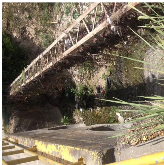
Puntos críticos zona rural de todos los santos fotos tomadas el 8 de agosto 2019