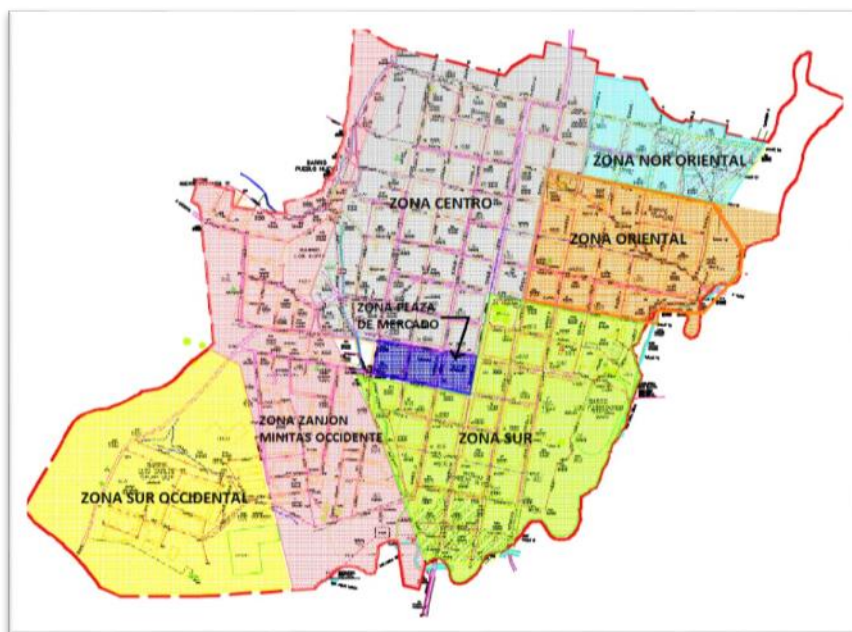
Imagen N°3 Sectores del sistema de alcantarillado

El sistema de alcantarillado, se encuentra dividido en 7 sectores o distritos distribuidos de la siguiente manera: