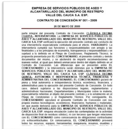
Imagen N°1 Contrato de Concesión 001 de 2009