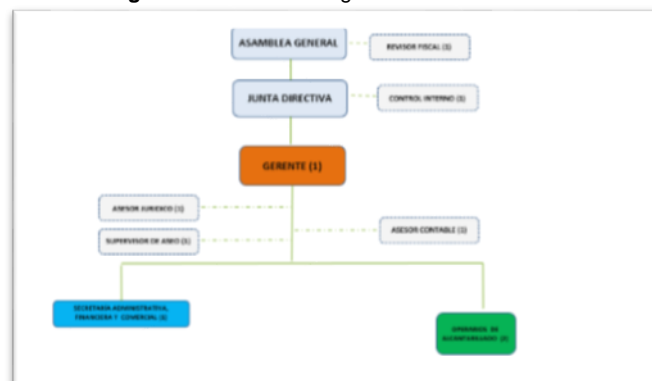
Imagen N°2 Estructura Organizacional de la Entidad

La estructura organizacional de EMRESTREPO S.A.E.S.P es la siguiente: