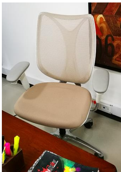
Silla Vicerrectoría Académica