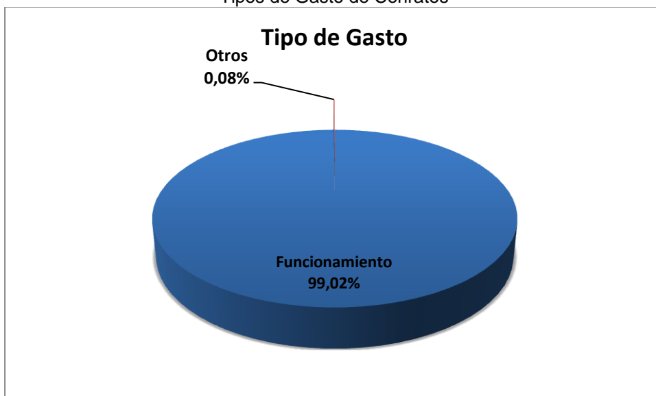
Gráfica No. 3 Tipos de Gasto de Contratos

Fuente: Sistema de Rendición de Cuentas en Línea –RCL Elaboró: Dirección Técnica de Infraestructura Física