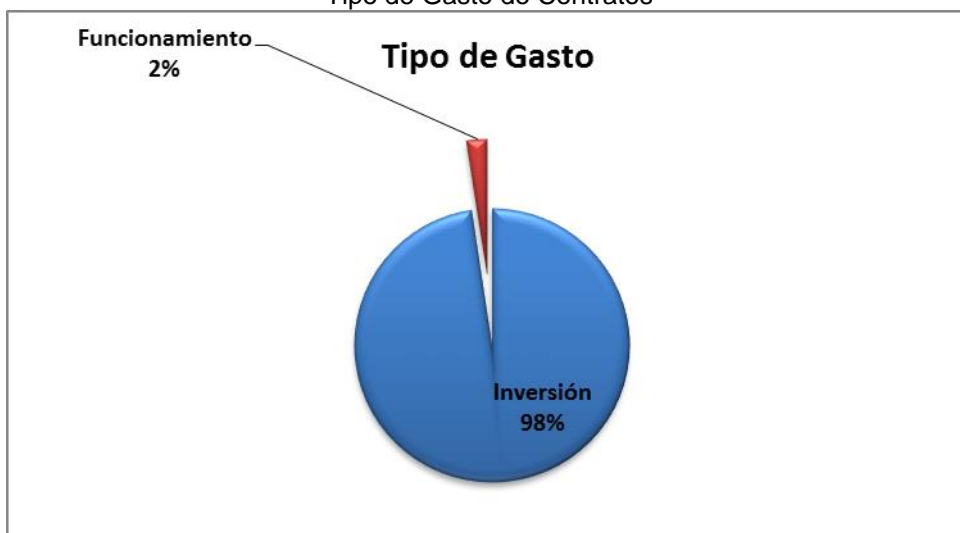
Grafico No. 3 Tipo de Gasto de Contratos