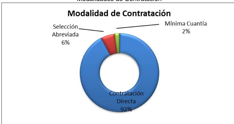
Grafico No. 1 Modalidades de Contratación

Fuente: Sistema de Rendición de Cuentas en Línea –RCL Elaboró: Dirección Técnica de Infraestructura Física