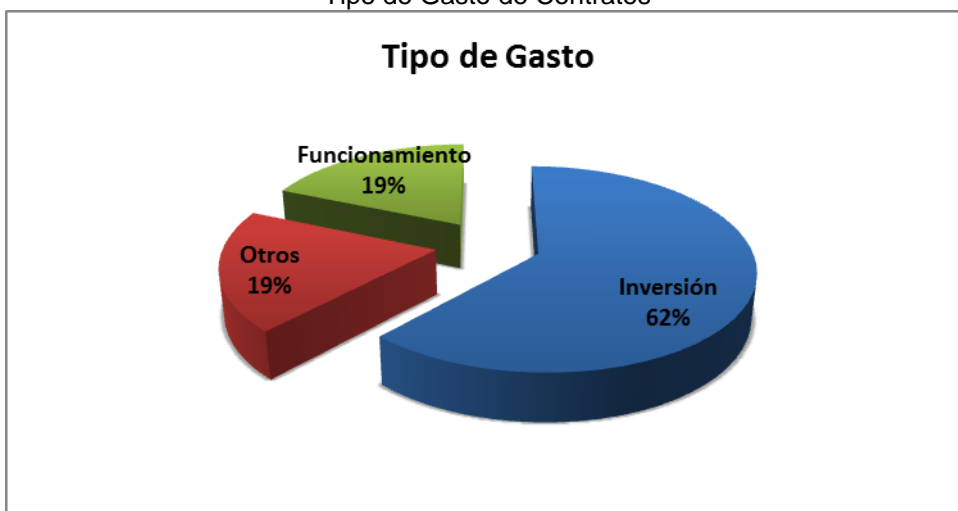
Grafico No. 3 Tipo de Gasto de Contratos

Fuente: Sistema de Rendición de Cuentas en Línea –RCL Elaboró: Dirección Técnica de Infraestructura Física