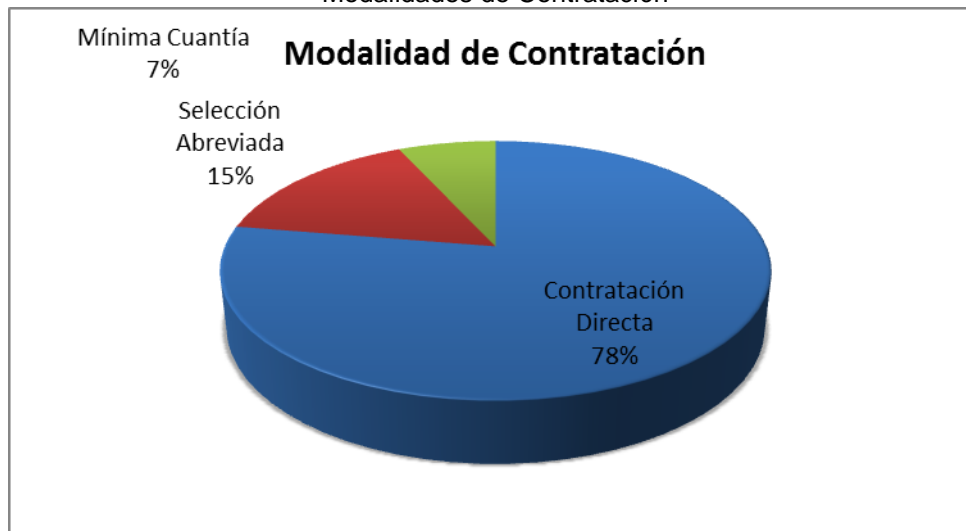
Grafico No. 1 Modalidades de Contratación

Fuente: Sistema de Rendición de Cuentas en Línea –RCL Elaboró: Dirección Técnica de Infraestructura Física