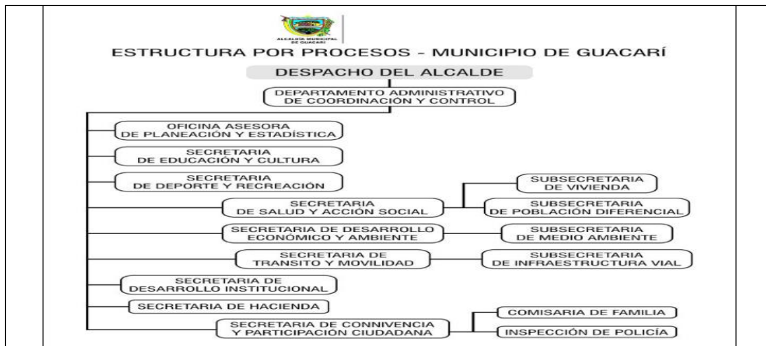
Cuadro No. 16

La estructura organizacional requiere ser ajustada, pues no figura en su conformación la oficina de Control Interno Disciplinario.