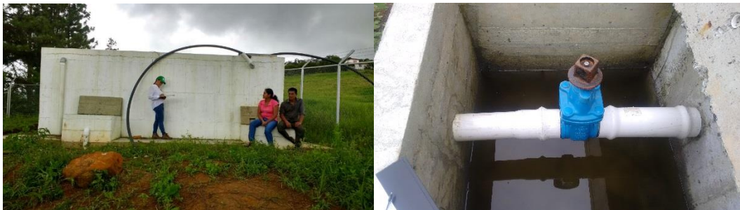
Acueducto de Ocache

El acueducto de Vidal y Ocache tienen que bombear el agua, lo que hace más costoso el tratamiento.