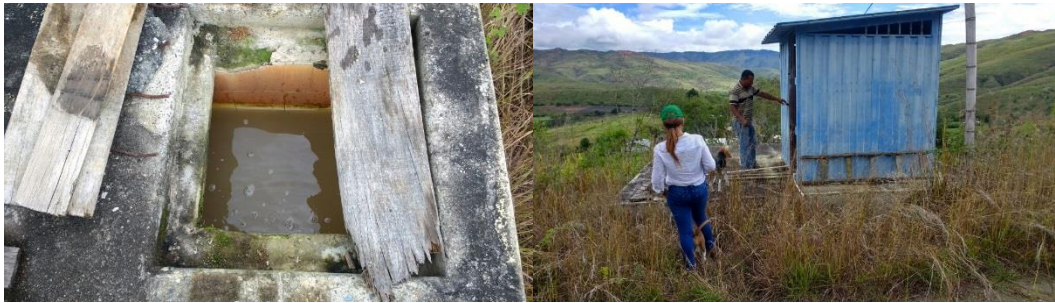
Acueducto de Mozambique