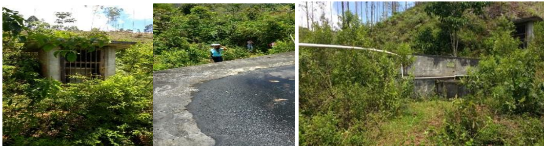
Acueducto La Fresnada