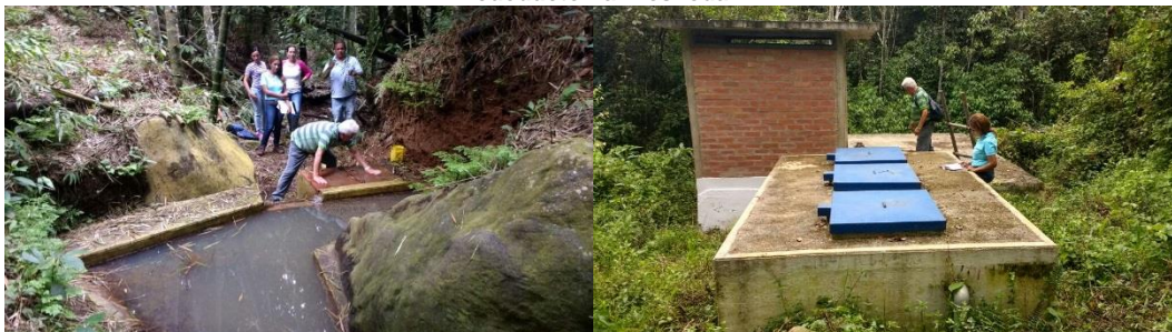
Acueducto El Tambor