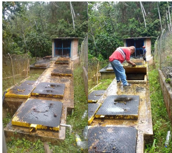
Acueducto la Rivera

El acueducto de Vidal y Ocache tienen que bombear el agua, lo que hace más costoso el tratamiento.