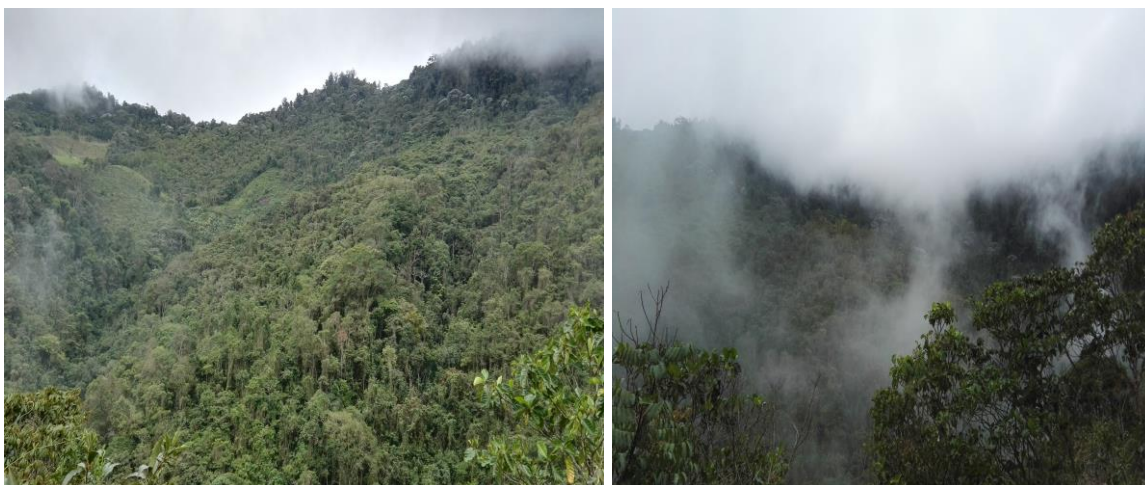
Vista del Predio La Ligia Cobertura Boscosa Densa

A continuación se presenta la cobertura boscosa presente en el Predio la Ligia.