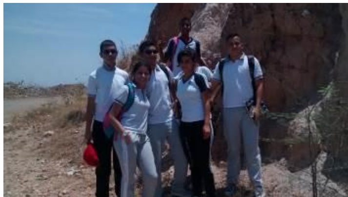
Equipo Jóvenes Auditores Sociales I.E. Jorge Robledo Vijes

Robledo, quienes realizaron control social participativo el martes 15 de septiembre/15, con la aplicación de encuesta relacionada con el tema del Comparendo Ambiental a los habitantes del Barrio Patio Bonito I y visita de inspección a sitio montañoso seleccionado por los estudiantes como crítico del Municipio por la acumulación indiscriminada de escombros y residuos sólidos, en el lote denominado “El Portachuelo”.