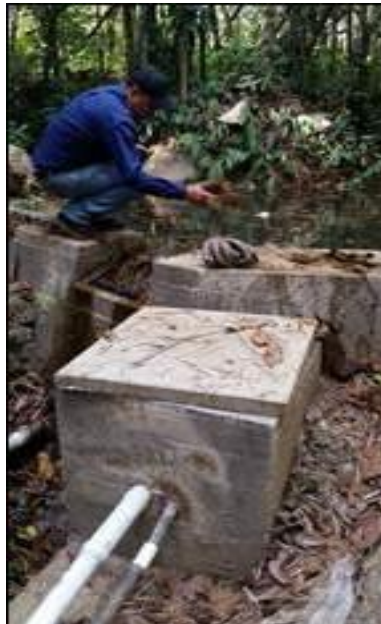
Tanque de rebose, rejillas y desarenador Acueducto Porvenir