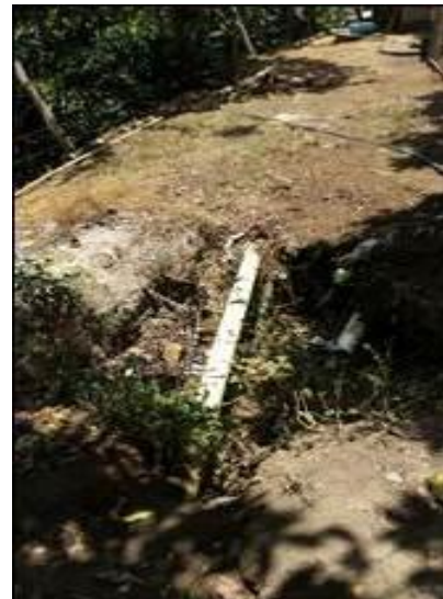
Sistema de Conducción tubería 3 pulgadas

Verificación y estado actual de Pozos Sépticos Corregimiento Cachimbal, se realizó la verificación de la construcción de 6 pozos sépticos en el Corregimiento,