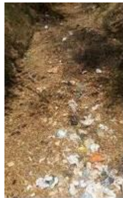
Margen Izquierda del Cauce Rio Vije