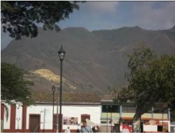
Montañas desprovistas de vegetación-zonas en estado de erosión severa

El Ente Territorial presenta deficiente labor de vigilancia y control a las Juntas administradoras de acueductos, que garantice el uso racional del agua, la equidad en la prestación del servicio al total de la población atendida, observándose la proliferación de conexiones de los usuarios a través de mangueras a lo largo de los recorridos efectuados a la zona rural. Presunto incumplimiento Art.3 Ley 373 de 1997; Artículo 365 Constitución Política de Colombia