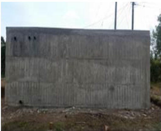
Tanque de Almacenamiento Corregimiento La Fresneda

-Verificación de construcción de tanques de almacenamiento con las siguientes dimensiones 5,5 * 5,5*2 metros, con una capacidad aproximada de 60 metros cúbicos, construcción de desarenadores, tanques de rebose y recuperación de bocatomas y rejillas en los siguientes acueductos rurales: Corregimientos Porvenir, Cachimbal, La Fresneda y Villamaría