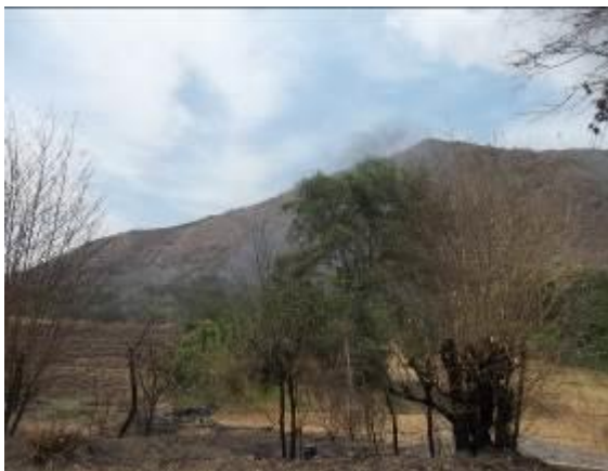
Quemas observada en recorrido por humedales