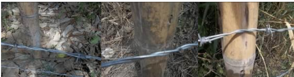
Hilos de alambre sin graparse al poste