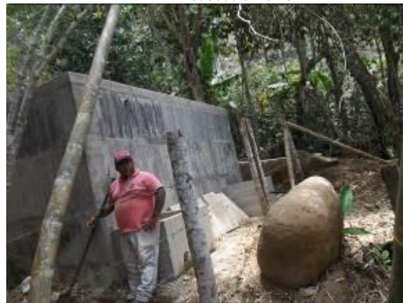
Tanque de almacenamiento en construcción Corregimiento Villamaría