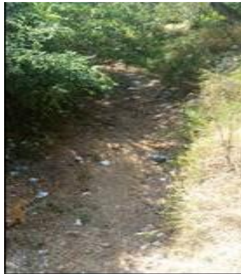
Bolsas con residuos depositadas en el cauce del rio Vije completamente seco