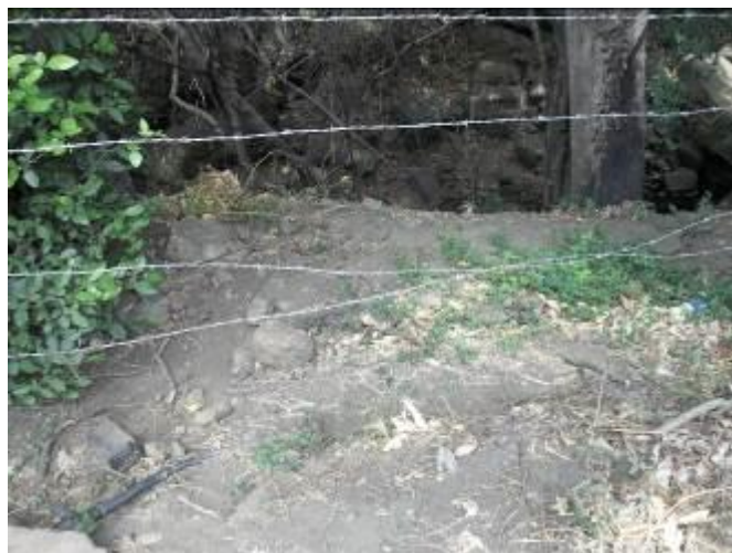
Aislamiento en mal estado