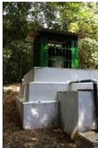
Sistema de Cloración y Tanque Cachimbal