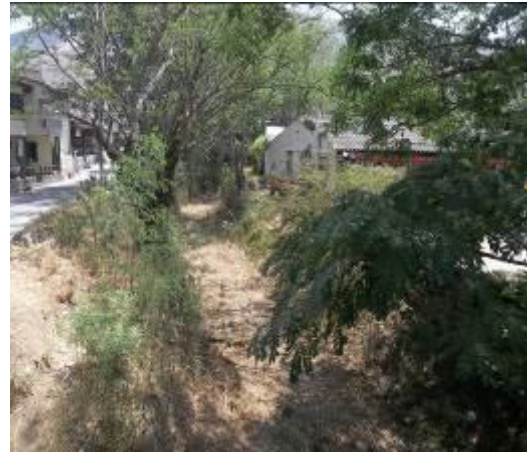
Cauce del río vijes en zona urbana del municipio completamente seco