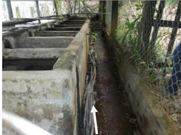
Alto número de mangueras conectadas a uno de los tanques de almacenamiento de agua (actual) cpto Villamaria-Parte alta