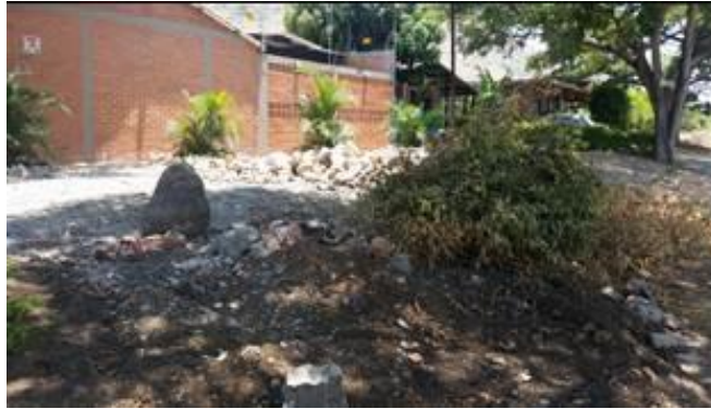
Parte Final Vía Principal Pavimentada Barrio Patio Bonito

Barrio Municipal: Al momento de la visita se observa limpia la zona donde se encontraba el punto crítico esto debido a la intervención de la Empresa Tuluaseo.