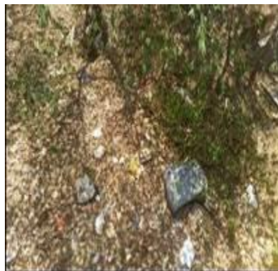
Margen derecha Cauce Rio Vije a la altura del B/Patio Bonito