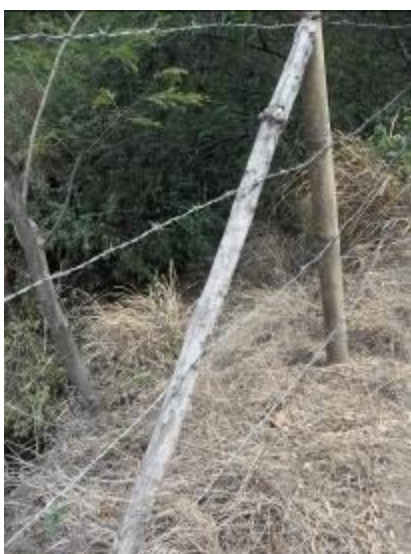
Pie de amigo de mala calidad