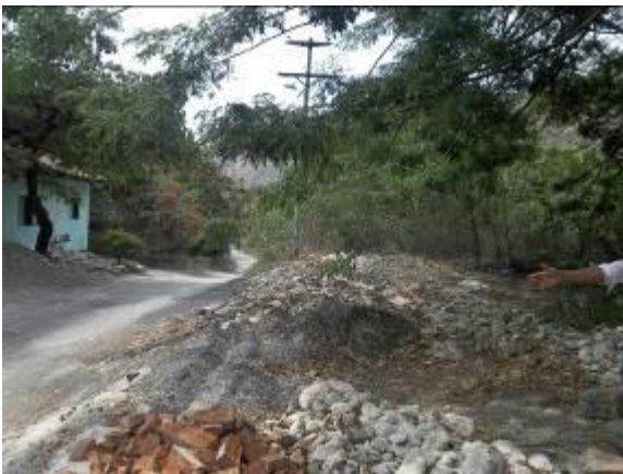
Materiales de construcción en vía a la quebrada Carbonero a un km del casco urbano

Por las deficiencias señaladas sobre el comparendo ambiental se determina presunto incumplimiento de lo dispuesto en los artículos 8, 9, 12, 18, 20 de la Ley 1259 de 2008; Artículo 8 del Decreto 3695 de 2009; Circular 057 de diciembre de 2010 Procuraduría General de la Nación; Artículo 65 numeral 7 y 9 de la Ley 99 de 1993, Artículo 3, 4 Resolución 541 de 1994 del Minambiente.