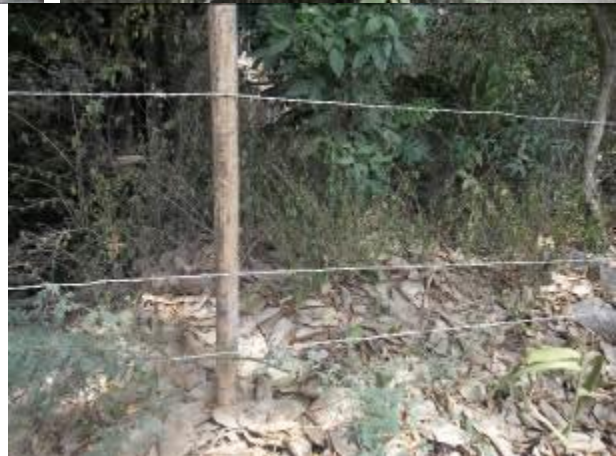
Posteatura de mala calidad y diferentes distancias entre alambre, obsérvese menor cantidad de hilos de alambre