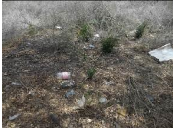
Disposición de residuos sólidos en zona de protección del cauce –seco (Vda Charco oscuro)