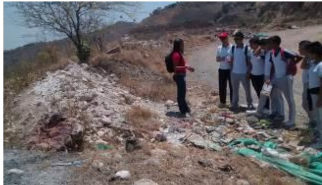
Visita a sitio Crítico Ambiental “El Portachuelo” (Vijes) con Jóvenes Auditores Sociales

La zona donde se disponen los escombros es una cantera de la cual hicieron extracción de material de piedra caliza, sin embargo la cantera no está siendo utilizada debido a que el acceso de los vehículos no es posible por la falta de vía hacia la parte baja de la cantera, generando con esto que la disposición se realice a la margen izquierda de la carretera en sentido Vijes – Yumbo, de igual forma no solo se depositan escombros sino toda clase de residuos. Como se muestra: