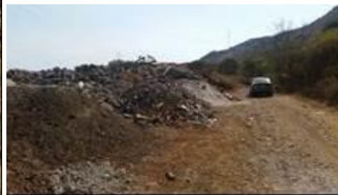
Disposición en la Vía