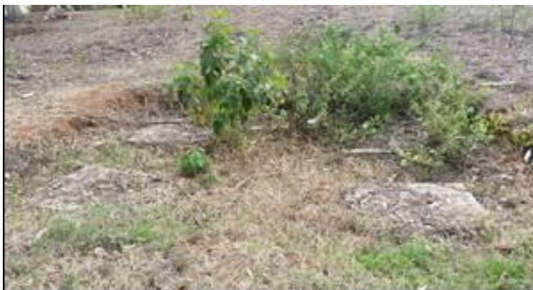
Sistema Séptico Escuela