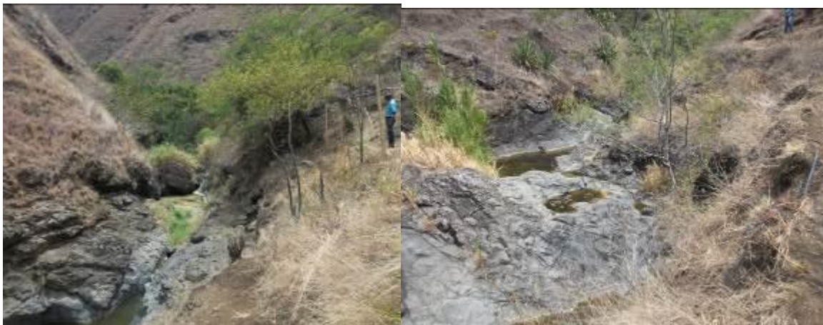
Zona de la quebrada objeto del aislamiento –agua estancada-cauce seco