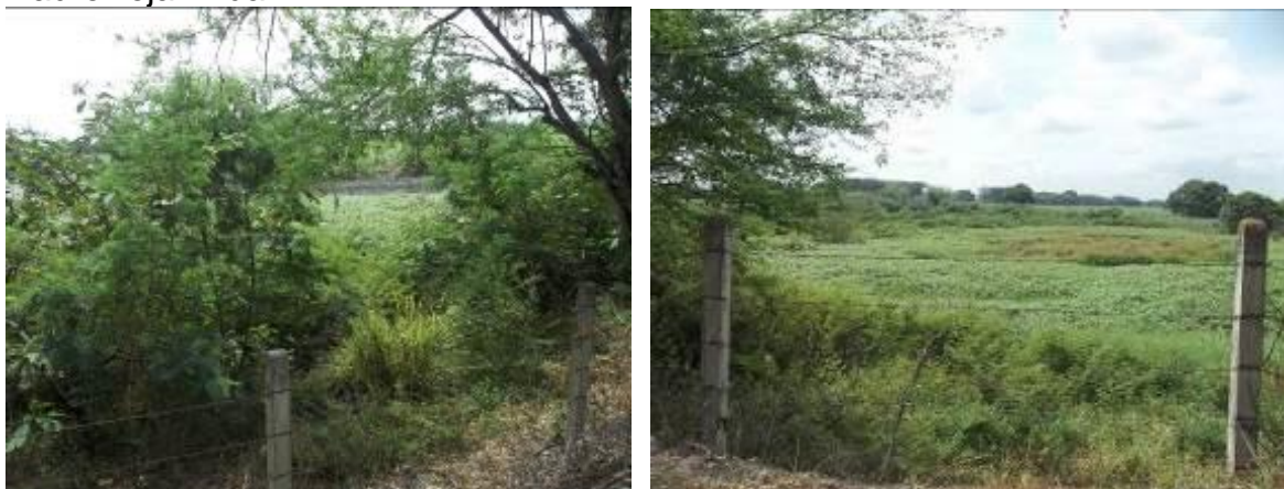
Pérdida completa del espejo lagunar-cambios en el uso del suelo