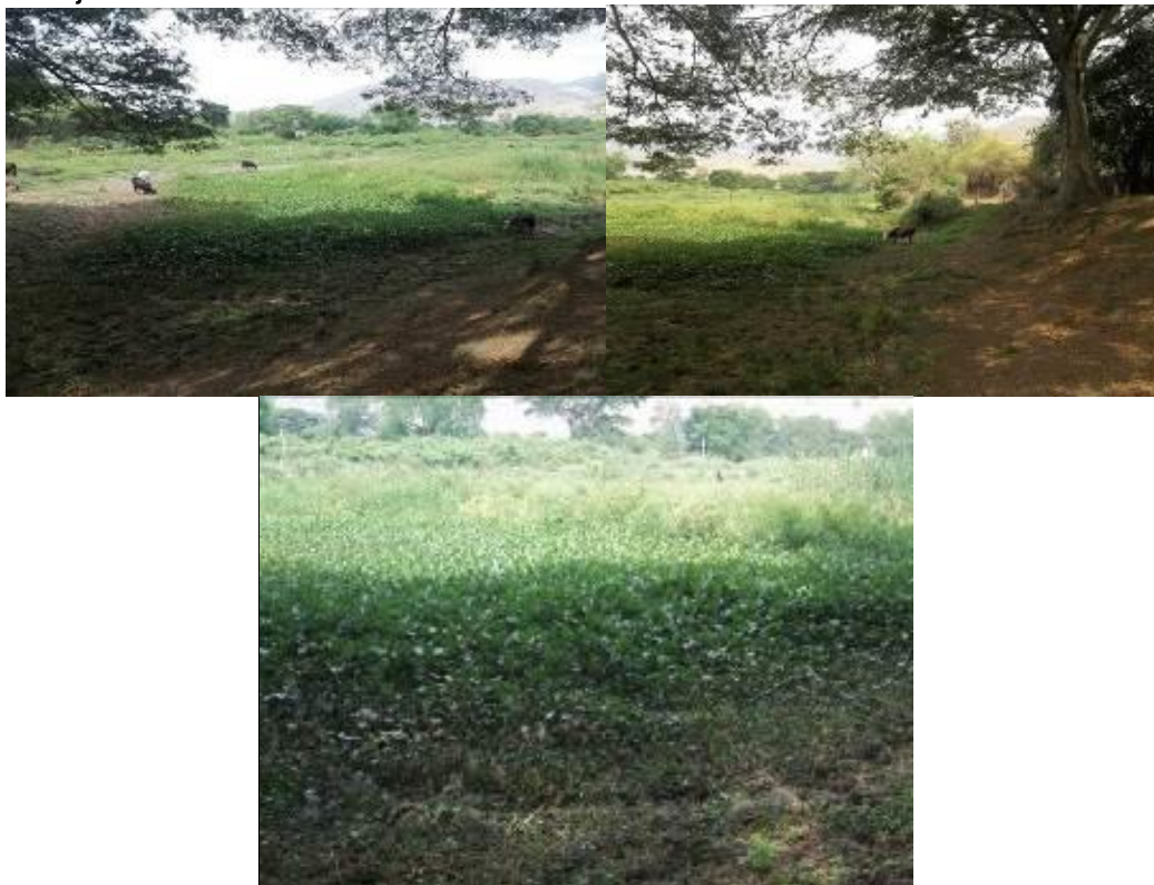
Gran parte del humedal en actividad agropecuaria y un área con buchón de agua, indicador de alto contenido de materia orgánica -Pérdida del espejo lagunar