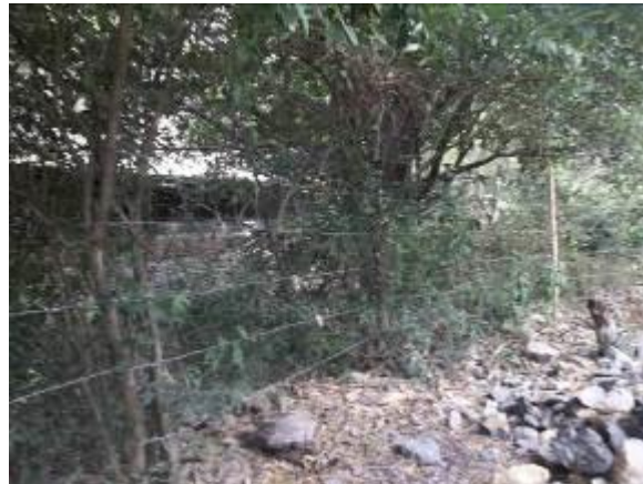
Utilización de los arboles como postes 5 hilos de alambre

¡Una Entidad Vigilante, una Comunidad en Acción!