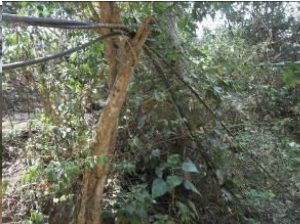
mangueras a lo largo de recorrido cgto Villamaria