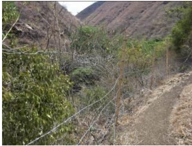
Tramos de aislamiento en el suelo o destemplado