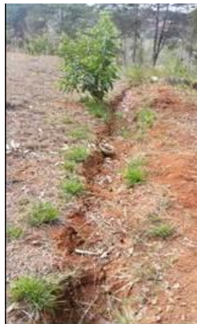
Campo de infiltración