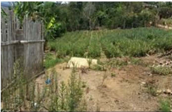
Pozos Sépticos y Campos de Infiltración

Verificación y estado actual de pozos sépticos, con el acompañamiento de los funcionarios de la Alcaldía Municipal se revisó y evaluó el estado actual de los pozos ubicados en viviendas del Corregimiento, no fue posible dialogar con los propietarios y beneficiarios toda vez que al momento de las visitas estos se encontraban laborando, sin embargo en diálogo sostenido con vecinos del sector estos manifestaron que ahí vivían las personas que se establecen como beneficiarios y los pozos se encuentran contruidos y en funcionamiento. Como se muestra en las imágenes.