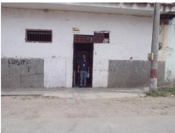
Bodega frente a calle principal