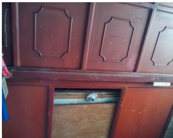
Cielo raso de bodega