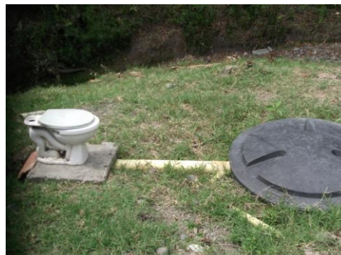
Imagen 2: Pozo séptico no utilizado.