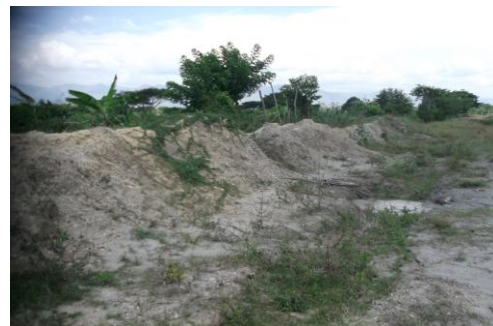
Imagen 4: La construcción del colector daña la conformación de la vía.