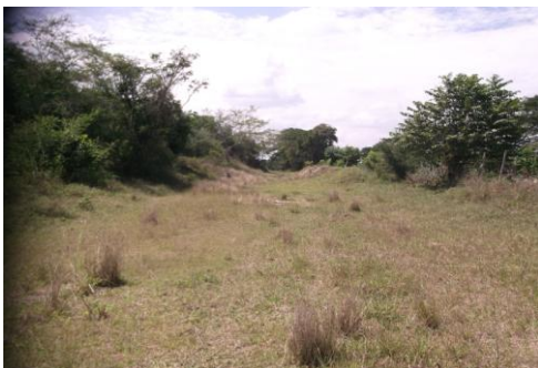
Imagen 3: Se puede evidenciar que no existe vía definida.

Todo esto determina la poca planeación que se tuvo para realizar este proyecto.