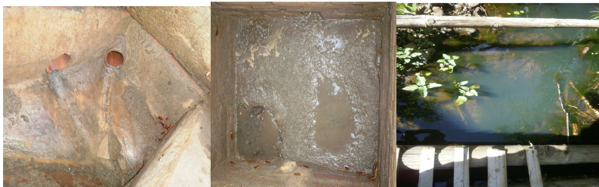
Pozo séptico Barrio La Inmaculada - Casco urbano Municipio