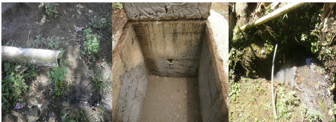
STAR Vereda Cordobitas

En visita de campo efectuada a Las veredas Cordobitas, Puntabrava, La Leticia y barrio La Inmaculada, con el fin de verificar la ejecución de los contratos de construcción, mantenimiento y adecuación de STARs y pozos sépticos, se observó que los sistemas están completamente colapsados y colmatados, por tanto no están funcionando actualmente en óptimas condiciones. De acuerdo a la comunidad consultada, no se les brindó capacitación para el mantenimiento. Se determina como Hallazgo administrativo.