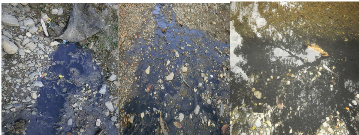
Aguas residuales vertidas inadecuadamente

De otra parte se presenta deficiente gestión en dos compromisos del Plan, así: