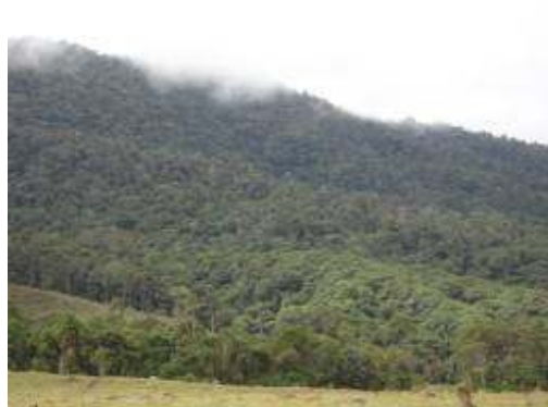
Predio La Cabaña

Por este concepto se ejecutaron $59.984.185 en control de áreas degradadas durante las vigencias evaluadas, evidenciándose: