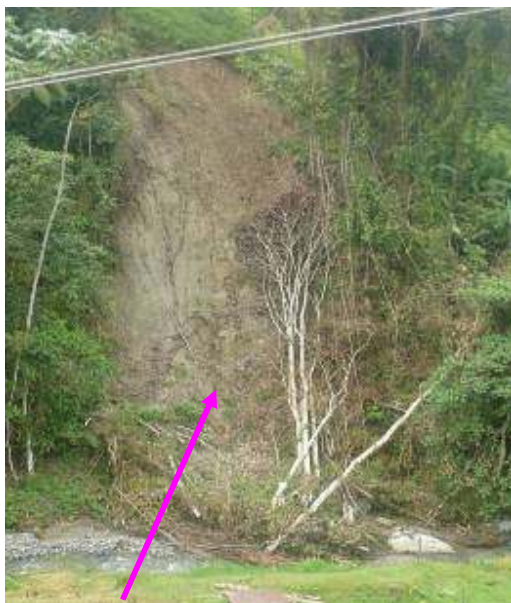
Desprendimiento masal a cauce de quebrada Area de influencia cuenca media rio Guadalajara

cauce. Se evidencia que el uso del suelo en la cuenca media es principalmente ganadera, se continúa la extracción de material de arrastre a todo lo largo del río, presuntamente sin controles. Ello evidencia la necesidad del ordenamiento ambiental de la cuenca con el objeto de destinar el uso de ésta, de acuerdo a su potencialidad y de manera concertada con los diferentes actores (HAD No.2)