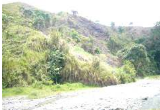
Áreas de ladera desprotegidas de cobertura vegetal por procesos erosivos ocasionados por actividad ganadera, afectando la regulación hídrica