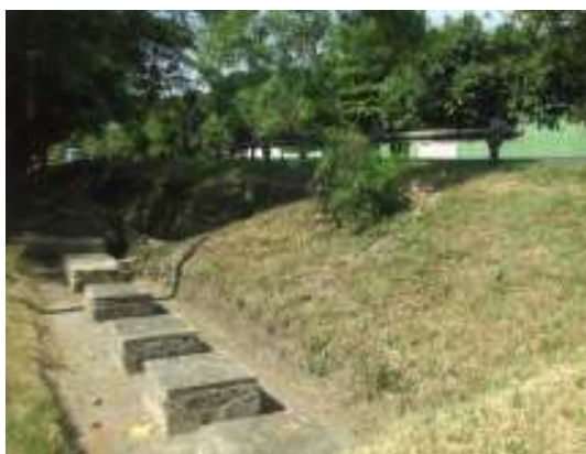
STAR vereda Pantanillo, objeto de Mantenimiento

Del análisis anterior se establece que las STARs visitadas objeto de mantenimiento a través de OT No.01, 03 del 2007 y No.04 del 2008, a excepción de la existente en la vereda Pantanillo, no están cumpliendo el objetivo de minimizar las cargas contaminantes que se vierten a las fuentes hídricas, por cuanto los residuos generados en su limpieza, se están arrojando a los suelos y cuerpos de agua, con el consiguiente riesgo para la salud humana, sin ningún control por parte de la Administración Municipal (se determina como un hecho mas del hallazgo administrativo disciplinario No.4)