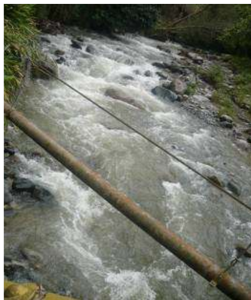
Cuenca media Río Guadalajara

En los Planes de Desarrollo citados anteriormente, el municipio no incorporó el Programa de uso eficiente y ahorro del agua, como lo estipula el parágrafo 1º del artículo 3 de la Ley 373 de 1997, independiente de que éste se incluya en el Plan de Acción de la Empresa prestadora del servicio de acueducto (HA-3)