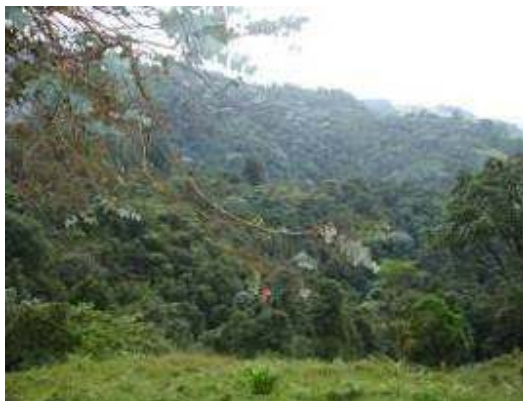
Vista general del Predio El Prado