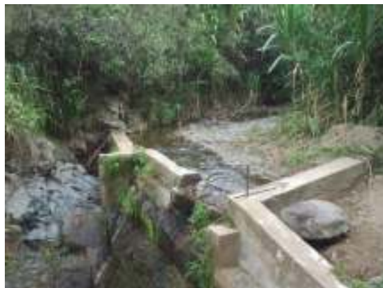
vista de la bocatoma acueducto municipal.