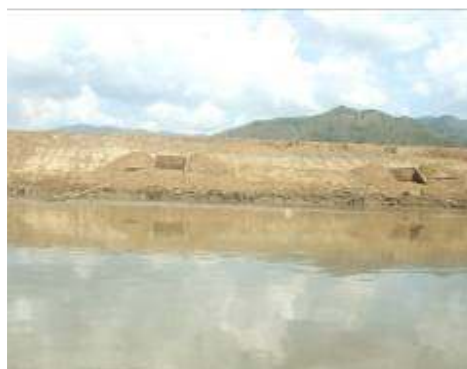
Dique de 400m para protección de la Laguna de Sonso