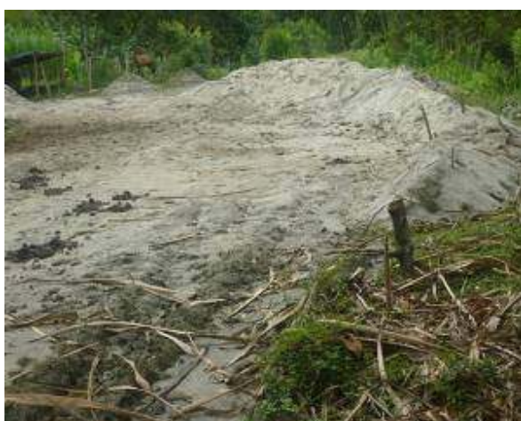
Extracción de material de arrastre río Guadalajara