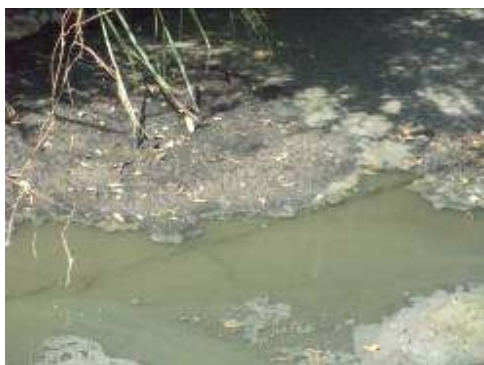
STAR corregimiento Guayabal