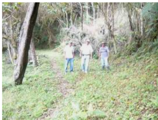
Servidumbre ubicada entre las áreas adquiridas del predio La Reina