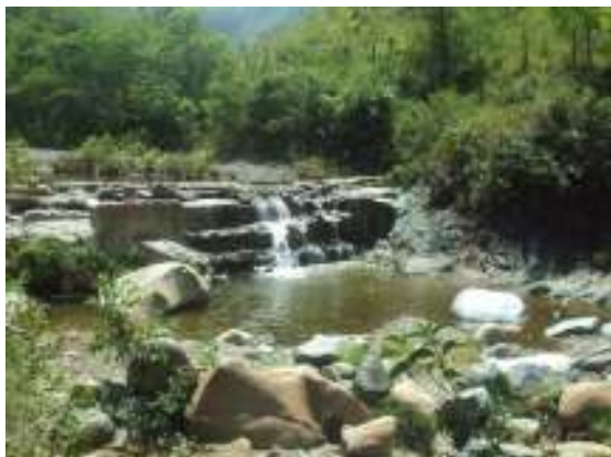
Parte rural río yotoco