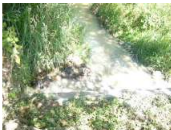
Punto de descarga del alcantarillado municipal a la quebrada el Yeso, que a su vez tributa al río Cauca