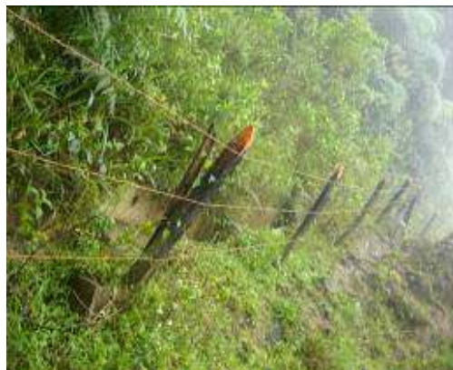
Cercas para protección del área degradada

- Contrato de obra pública SAF-029 de 2008 , cuyo objeto fue la realización control erosión en la Finca El Pensil, ubicada en la vereda La Primavera, consistente en construcción de trinchos, siembra de especies forestales nativas, gaviones y canaletas.