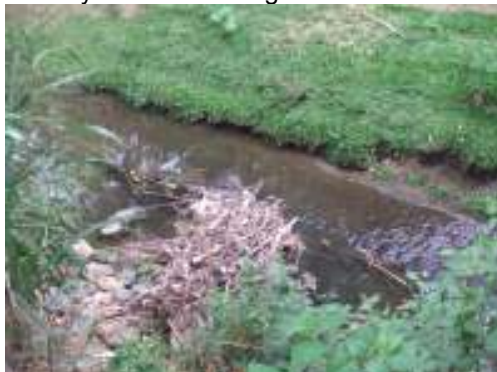
Cauce del río yotoco zona urbana B/ La Inmaculada municipio con minino caudal