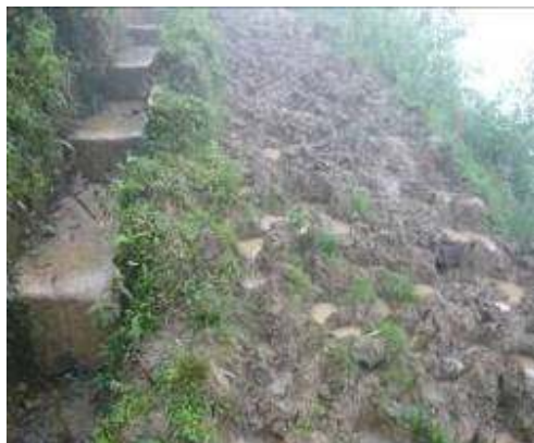
Pisoteo de ganado en el predio intervenido No se suscribió acta de compromiso con propietario