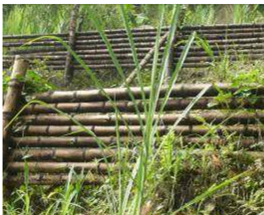
Trinchos en guadua recuperación áreas degradadas