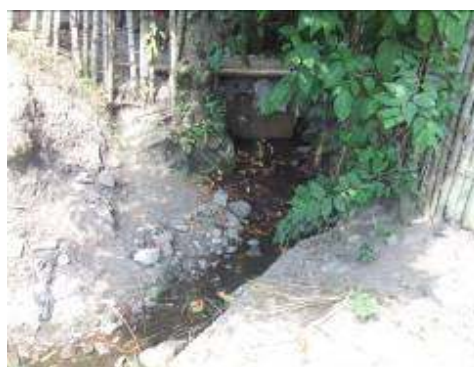
vertimiento proveniente de la STAR Agüitas