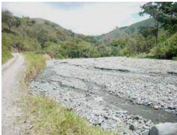
Cauce del río San Pedro en la cuenca media, con mínimo caudal