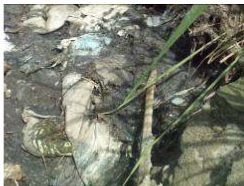
vertimiento a la Quebrada San Pedro

-Se evidenciaron presuntas irregularidades en el cumplimiento del contrato de consultoría No.04 de 2007, por $14.000.000, cuyo objeto fue la elaboración del diseño y estudio de PTAR del corregimiento de San José, por cuanto su producto es un informe ya realizado por el mismo contratista en la vigencia 2004, en el cual solo se modifican las fechas, además, el contratista no presentó planos de ubicación del predio, levantamiento topográfico, datos actualizados de la población, caudal, carga contaminante y demás indicadores necesarios para estos diseños, esto aunado al hecho que a la fecha de la auditoria no está construida la PTAR en esta vereda, lo cual se determina como una presunta mala gestión, debido a que el Municipio realiza inversión de recursos que no garantizan beneficio social alguno, ni mejoramiento de la calidad hídrica (Hallazgo administrativo disciplinario y fiscal No.10).