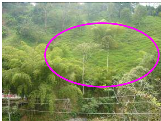
Procesos erosivos característicos de actividad ganadera