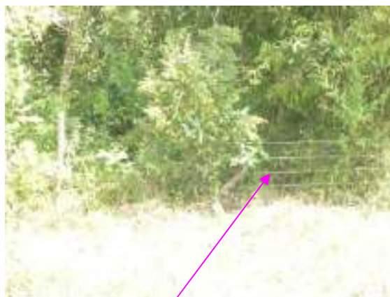
Trabajos de aislamiento y siembra para la conservación recurso hídrico quebrada La Grecia Finca La Linda

En la vigencia 2008 el Municipio ejecuta gastos por $5.585.650 en compra de materiales, transporte de los mismos, sin que se evidencien actos administrativos que soporten la erogación, como tampoco los soportes que evidencien el cumplimiento de dichas actividades, recibos del bien o servicio por parte de la comunidad o juntas directivas, a fin de identificar su cumplimiento, se limita para las visitas. Se determina como un hecho más del HA-12.