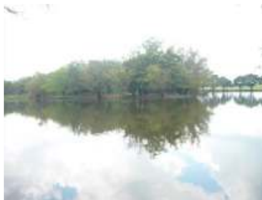
Humedales Roman Gota'e leche