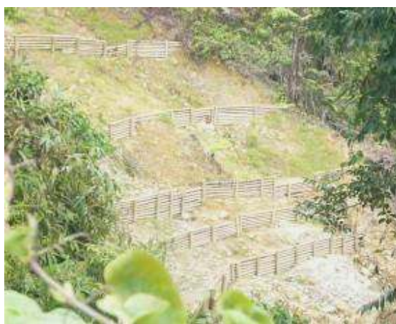
Predio La Tribuna, trabajos de recuperación de áreas degradadas, canalización y evacuación de aguas que afectaban el terreno y construcción de trinchos

-Convenio No.011 de 2007, celebrado con la Asociación para el desarrollo social integral - ECATE, por $10.000.000, con el objeto de aunar esfuerzos técnicos, económicos, físicos y humanos en la realización de acciones tendientes a la implementación de la propuesta de trabajo para la capacitación, sensibilización y organización en torno a la protección de los recursos naturales, en especial el recurso agua en cinco comunidades del municipio de San Pedro, con obligaciones como la sensibilización y capacitación a 200 niños y 60 líderes comunitarios representantes de las juntas de acción comunal, asociación de madres comunitarias y asociación de padres de familia en el cuidado, uso racional del recurso agua, entre otras.