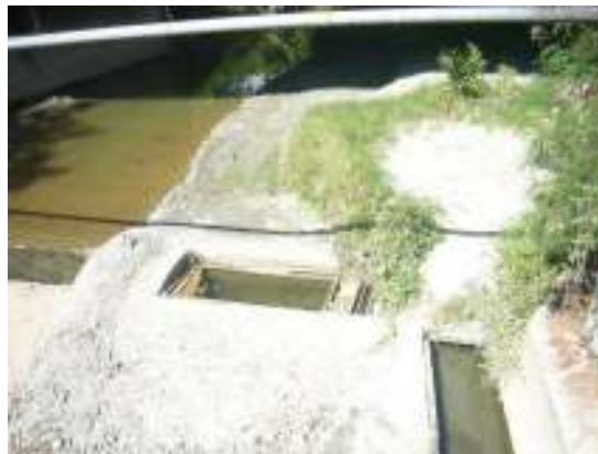
Quebrada Artieta (río San Pedro), a su paso por el casco urbano del municipio, obsérvese color de sus aguas, escaso caudal y aforos