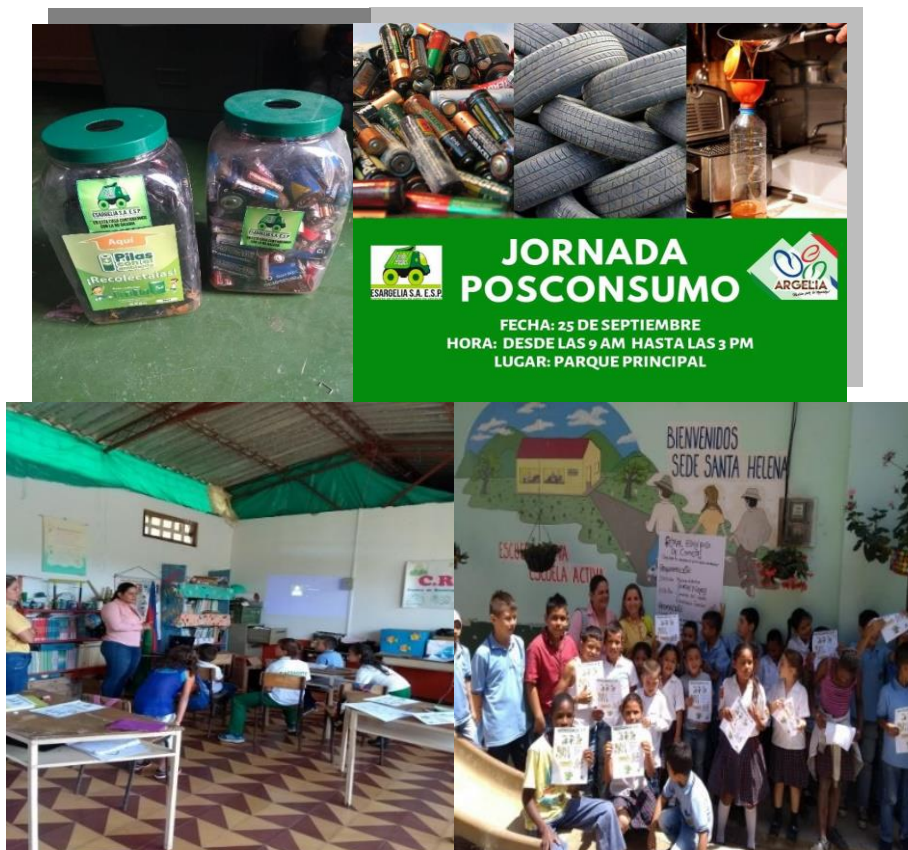
Registro fotográfico de las Campañas educativas.