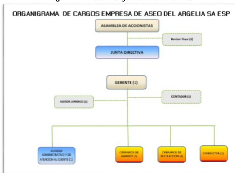
Imagen N°1 Estructura Organizacional de la Entidad