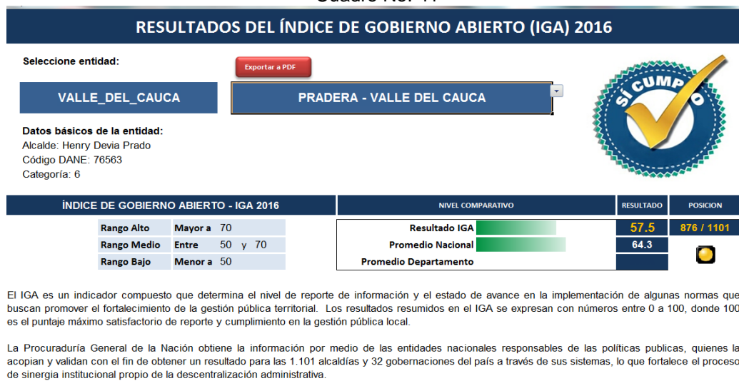
Cuadro No. 41

La entrada en vigencia de los Decretos 648 del 19 de abril de 2017 y 1499 del 11 de septiembre de 2017, al igual que el manual para la implementación del MIPG 2 (Modelo Integrado de Planeación y Gestión) derogó la presentación de la encuesta anual de control interno que daba origen al análisis del nivel de madurez.