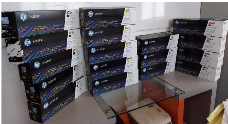
Diecisiete (17) tóners originales en su caja.

Se adjunta las imágenes de los tóners encontrados.