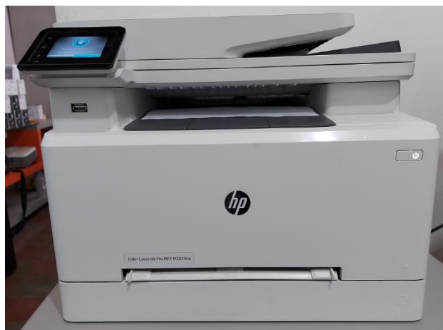
Impresora HP LaserJet Pro MFP M281fdw

Se realizó la verificación de los tóners adquiridos y se pudo verificar que en el momento en la Secretaria de Planeación, contaban con veintiún (21) tóners totalmente originales discriminados de la siguiente manera: