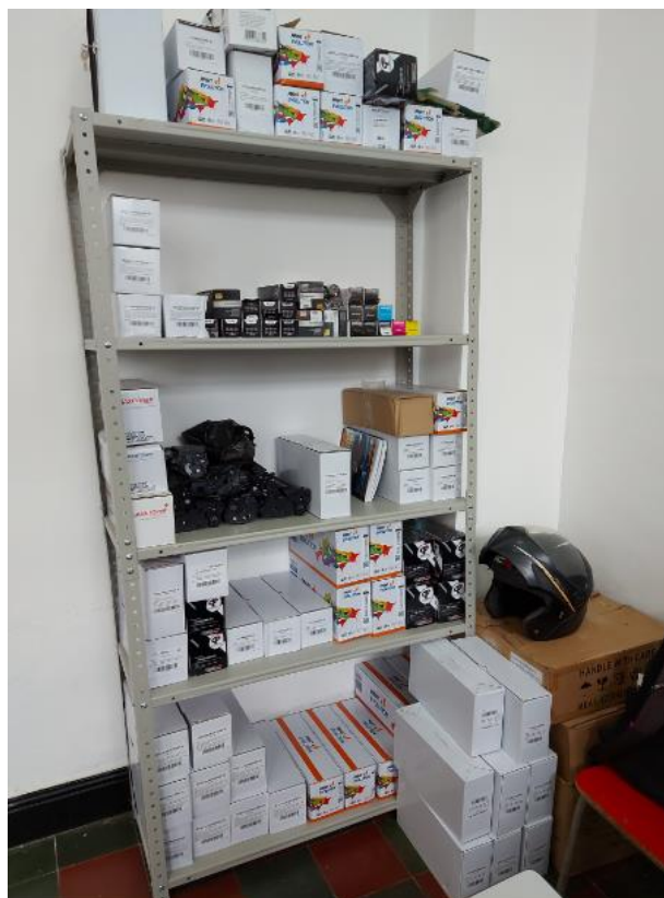
Insumos de impresión existentes en el Almacén