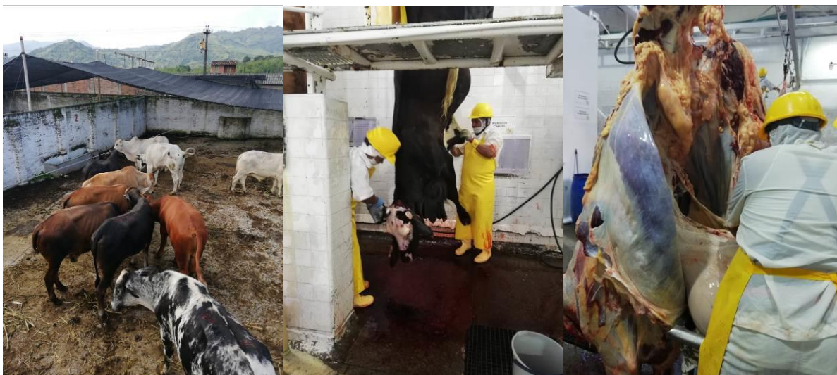
Registro fotográfico sacrificio de ganado

Presta servicios de sacrificio de especies bovinas y porcinas para suplir la demanda local y parte de la demanda regional como municipios vecinos tales como Sevilla y municipios cercanos del Quindío.