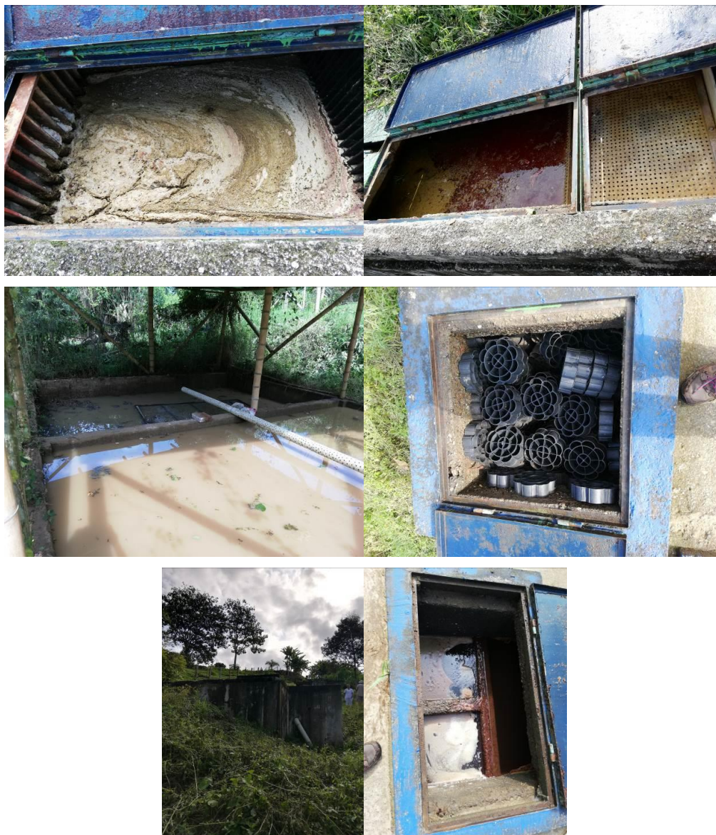
Registro fotográfico PTAR planta de sacrificio

Se evidenció que la PTAR de la planta de sacrificio de las Empresas Varias de Caicedonia EVC E.S.P., no estaba en funcionamiento en el momento de la visita, por que el operador estaba incapacitado, adicionalmente le falta mantenimiento a las componentes del sistema, los alrededores se observó enmalezado. Presentando falencias en la aplicación de la Resolución 0631 de 2015. Situación que se da por la ausencia de un plan de contingencia para estos casos. Ocasionado que la carga contaminante que se está entregando al efluente no cumpla con los máximos permisibles en vertimiento puntuales.