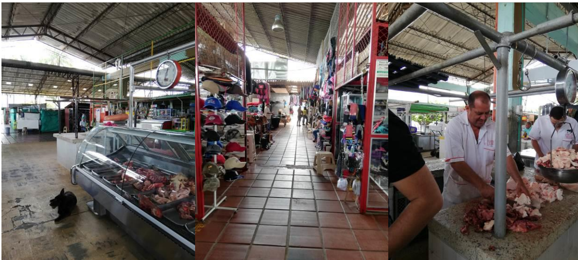
Registro fotográfico Plaza de Mercado de Caicedonia

Adicionalmente a las empresas varias se le entregó la administración del corredor gastronómico sabor y arte, el cual lo componen 6 locales