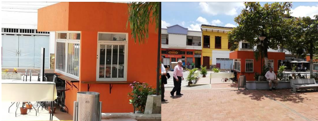
Registro fotográfico corredor gastronómico Sabor y Arte

Adicionalmente a las empresas varias se le entregó la administración del corredor gastronómico sabor y arte, el cual lo componen 6 locales