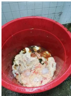
Registro fotográfico del decomiso

No se evidenció si todos los órganos decomisados con riesgos biológicos se entregan a RH, porque solo se coloca el peso, no el tipo de órgano. Presentado falencias en la aplicación del título 6 Residuos peligrosos del Decreto 1076 de 2015, Decreto único reglamentario del sector ambiente y desarrollo sostenible. Situación que se da porque no se tiene implementado en el protocolo de decomiso esta actividad, en consecuencia se puede presentar que no se le de el tratamiento que se requiere al riesgo biológico, ocasionando un posible riesgos en la salud humana.