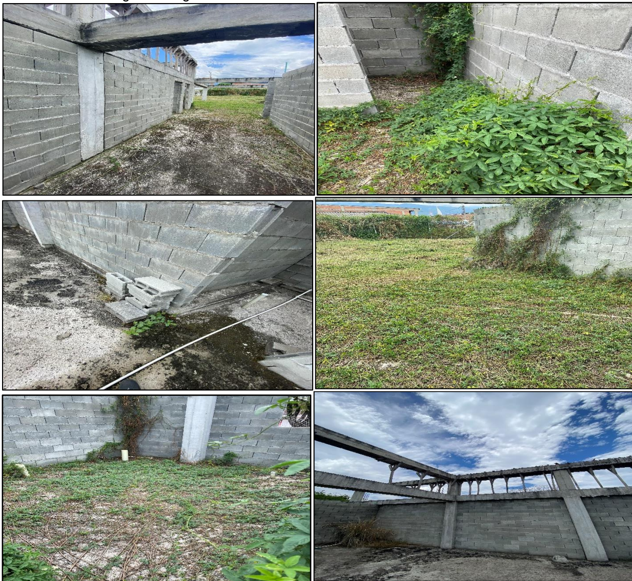
Ilustración No. 3 Registro fotográfico de visita fiscal