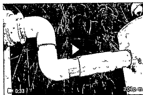
Instalación tercer filtro