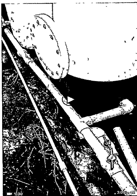
Instalación del sistema a la aducción

Se espera la realización de pruebas por parte de la UES Valle, para definir si se mejoró la calidad del agua, por lo que continuaremos pendientes, sin embargo las propuestas se ejecutaron.