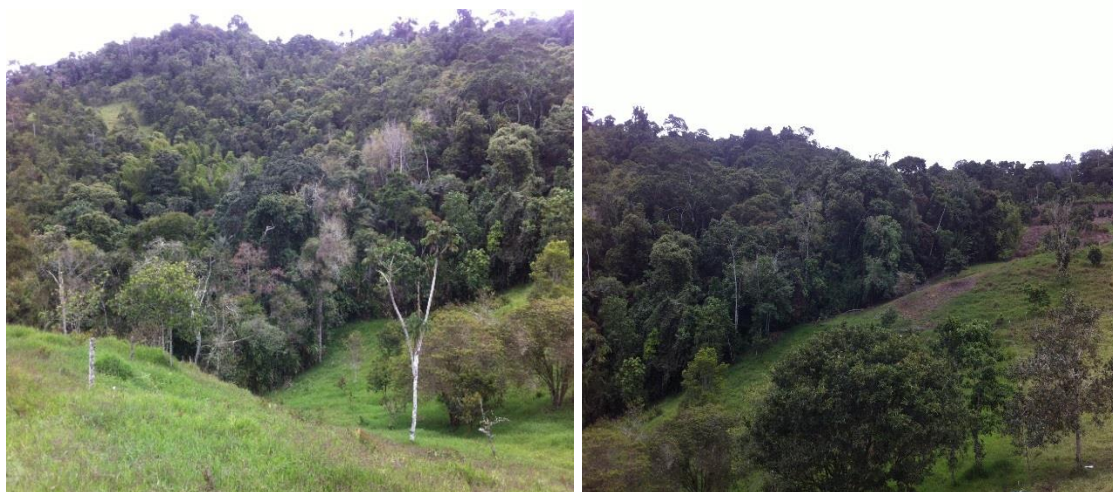
Predio El Recuerdo ubicado en la vereda La Virginia del Municipio de El Dovio