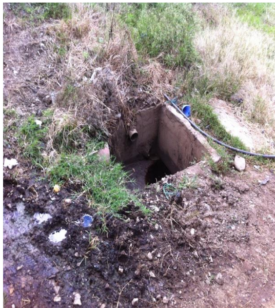
Tanque de los lixiviados sin el tratamiento adecuado