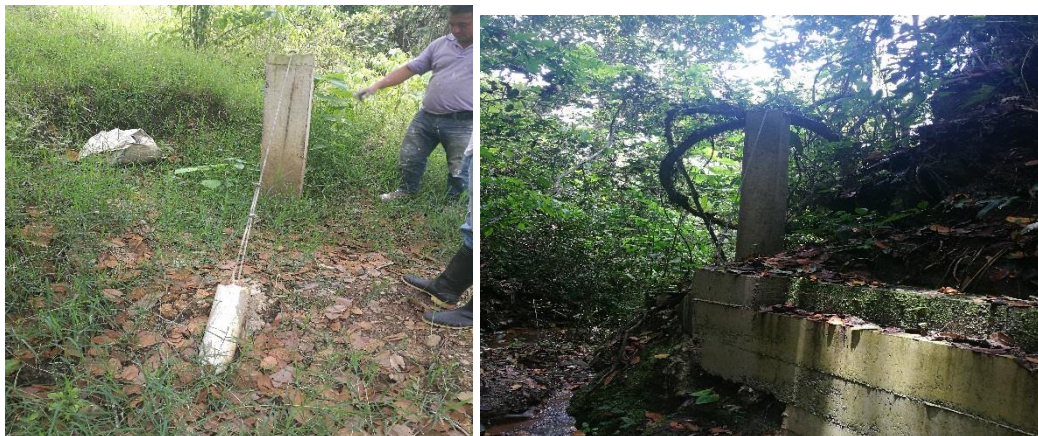
Muro de Concreto y Anclajes a el Suelo – La María

este acueducto surte un proceso de denuncia ciudadana en la Contraloría Departamental, el cual a la fecha es objeto de investigación.