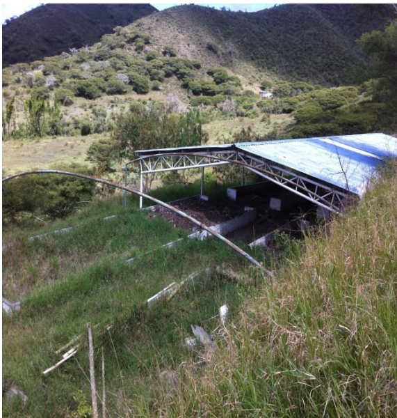
Las camas de las PMIRS enmalezadas Sin funcionar.

Lo anterior se da por la falta de mecanismos de control y seguimiento que no permiten advertir el problema. Generando con esto una ineffectividad en el trabajo del funcionamiento de la planta, lo que puede conllevar a un riesgo ambiental y sanitario. Lo que se constituye en un presunto incumplimiento de lo dispuesto en el artículo 88 del Decreto 2981 de 2013 y la Resolución 0754 del 2014, en concordancia con el numeral 1 de los artículos 34 y 35 de la Ley 734 de 2002.