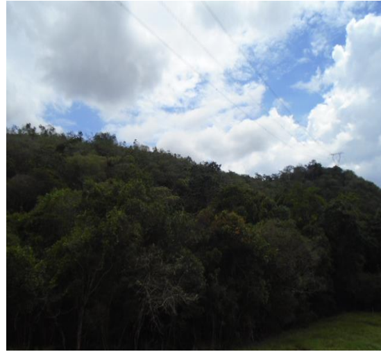
Predio los negritos de reserva forestal sin señalamiento