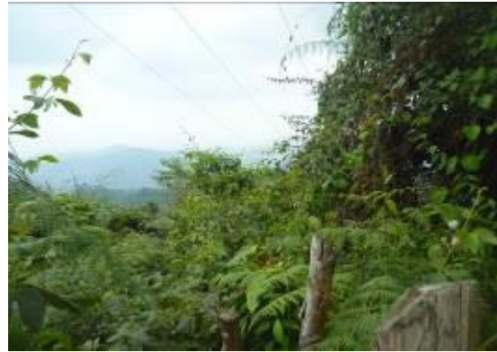
Predios el porvenir aislamiento parcial santa Elena sin aislamiento