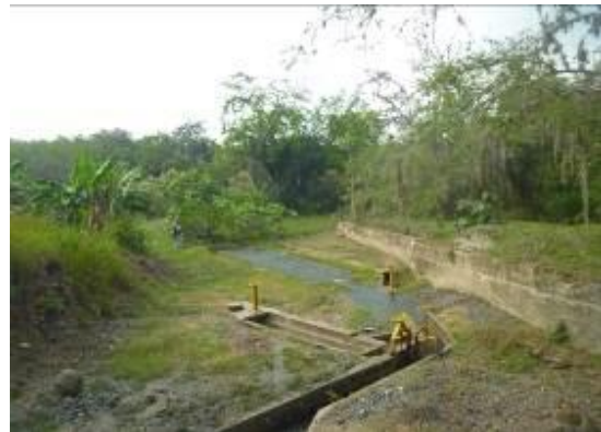
Acueductos que beneficia el corregimiento de los chancos