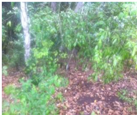
Predio la playita del donde no se evidencia vallas 2015