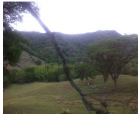
Predio comprado 2012, surte al acueducto de la paila