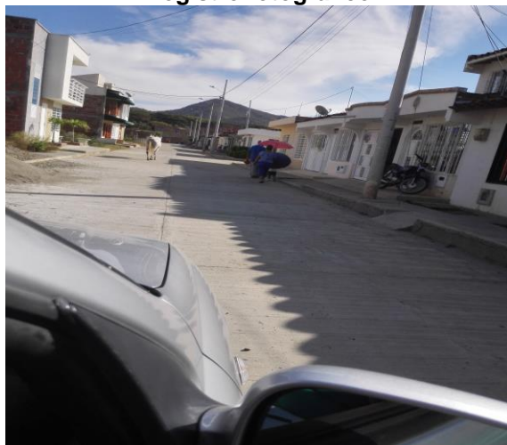
Barrio el Oasis

Proyecto “Reposición total de las vías carrera 6 entre calle 6 y 7, y carrera 8 entre calles 7 y 8 de la zona urbana del Municipio de Roldanillo, Valle del Cauca, Occidente”