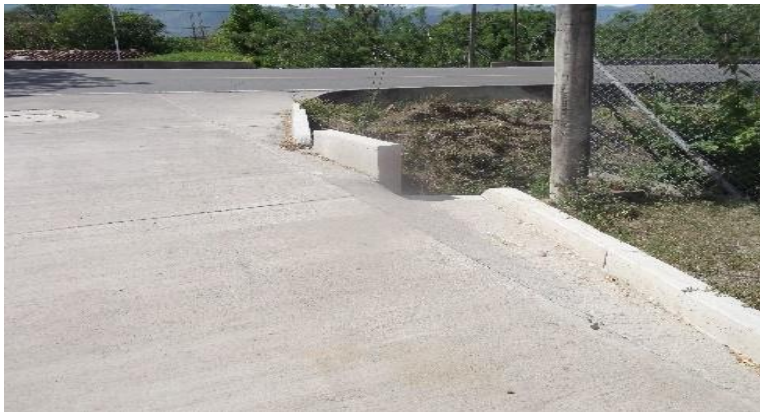
Cuadro No. 9

Impacto altamente positivo, por la recuperación total del segmento afectado, en un pavimento que ha cumplido con las especificaciones técnicas que este tipo de obras conllevan.