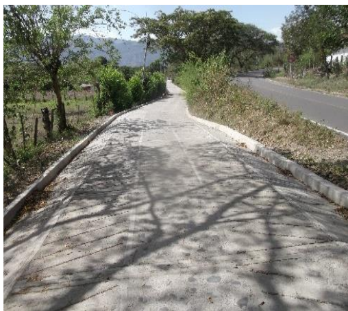
Cuadro No. 10

Estado: Obra entregada a satisfacción de las partes.