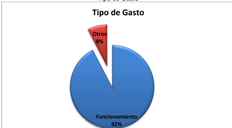
Gráfica No. 2 Tipo de Gasto

Fuente: Sistema de Rendición de Cuentas en Línea –RCL Elaboró: Dirección Técnica de Infraestructura Física