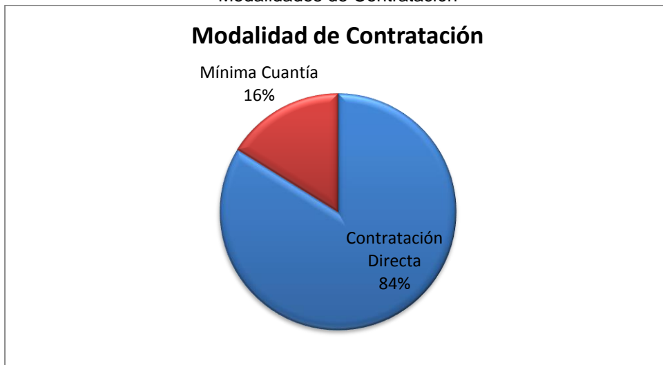
Gráfica No. 1 Modalidades de Contratación

Fuente: Sistema de Rendición de Cuentas en Línea –RCL Elaboró: Dirección Técnica de Infraestructura Física