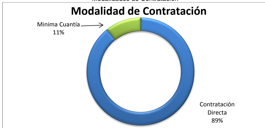
Modalidades de Contratación