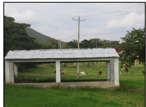
Lecho de Secado PTAR San Luis

El sistema de tratamiento de aguas residuales está compuesto por: