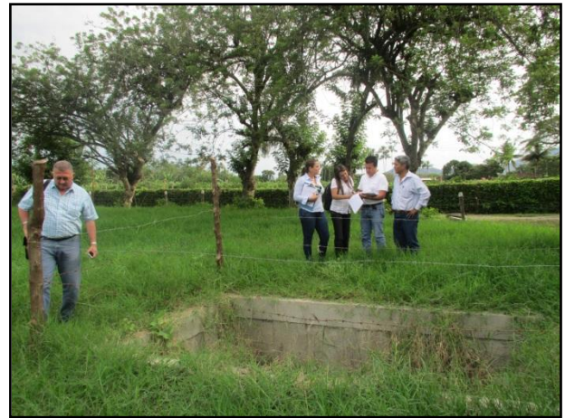
Desarenador de PTAR San Luis