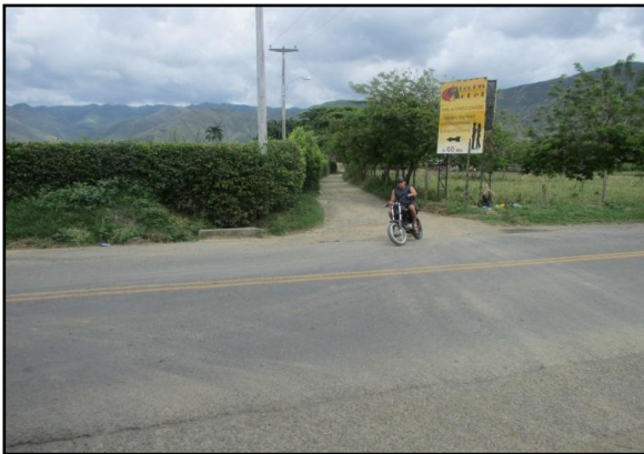
Sitio donde se ubica pase subterráneo sobre vía INIVIAS vereda Martindoza