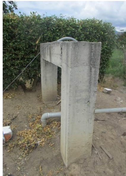
Estructura de viaducto

Los beneficiarios del Corregimiento Martindoza del que se abastecerían del acueducto en mención son 253 Habitantes, situación que no se está generando por problemas de predios públicos apropiados por la comunidad, Faltantes de tramos para completar el acueducto, un Viaducto en deterioro .y la conexión con el Acueducto de ACUAVALLE de Toro que sería el abastecedor y posible operados, una vez se realicen las pruebas de calidad y liquidación de la obra.