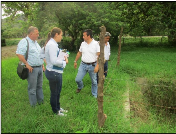
Comisión de Visita a Obra PTAR Corregimiento San Luis Municipio de La Unión Valle