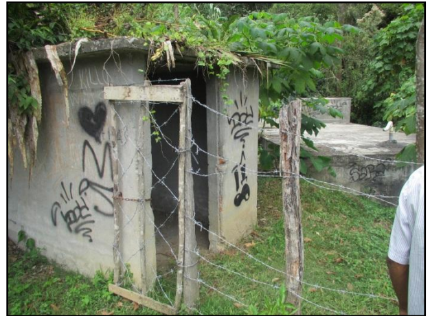
Ubicación PTAR, Vereda Pájaro de Oro