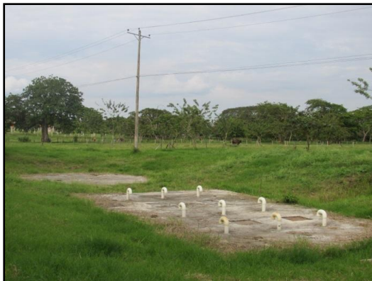
Tanque Séptico PTAR San Luis y al fondo Filtro Anaerobio