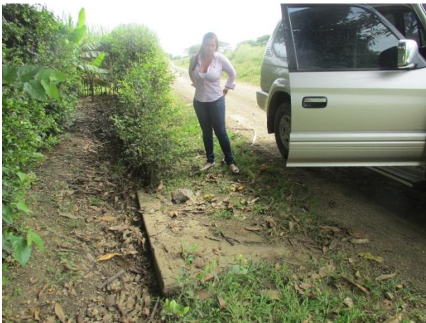
Caja de donde se empalmaría el acueducto Corcega