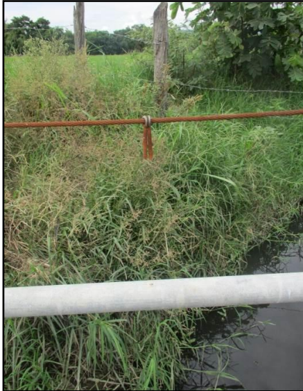
Estructura de viaducto sin funcionamiento