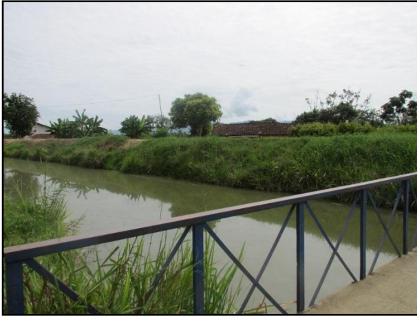
Localización de vivienda que serían beneficiadas