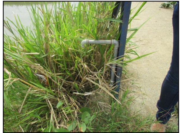
Localización de tubería sin remate