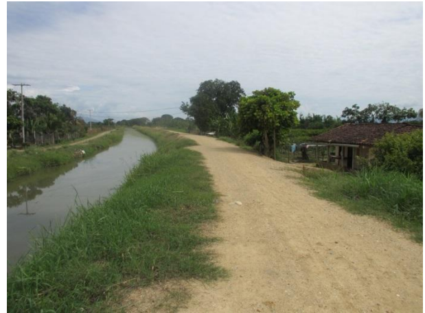
Localización de vivienda que serían beneficiadas

Los beneficiarios del Corregimiento Córcega del que se abastecerían del acueducto denominado con el mismo nombre, son 533 habitantes donde se observó (puesto de salud, institución educativa, agricultores de la zona y comunidad en general); evidenciándose de esta manera que el propósito de la contratación no ha sido el resultado provisto y pactado en el objeto contractual.