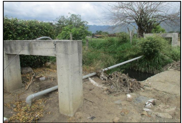
Estructura de viaducto sin funcionamiento