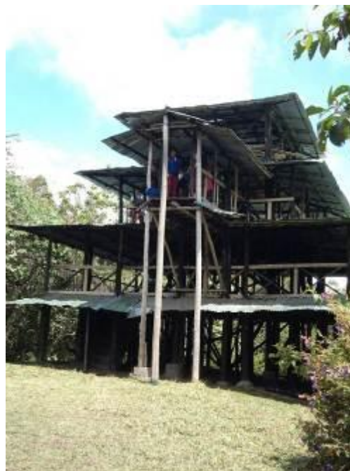
Vista de uno de los puentes y Mirador del sendero ecológico Aguas Lindas objeto de adecuaciones locativas

Se observa en el material fotográfico los puentes objeto de adecuación y mejoramiento y el mirador que se encontraba deteriorado, esto para seguridad de los visitantes.