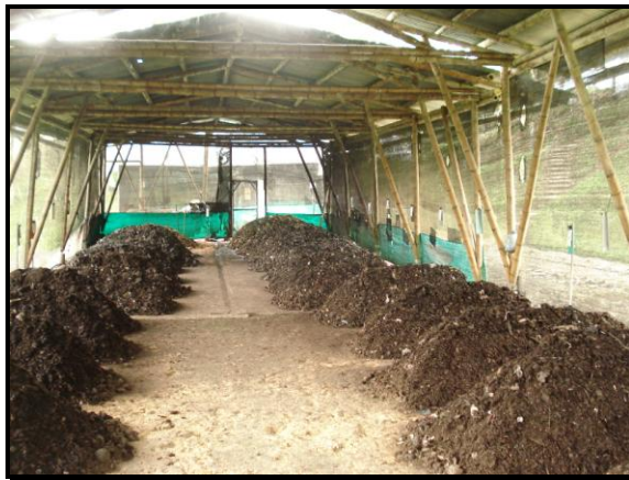
Transformación de material orgánico en compostaje

Se aprecia en el material fotográfico, operarios realizando labores de separación y la producción de compostaje con la materia orgánica. La PMIRS da la oportunidad de darle un nuevo uso a los residuos que se generan.